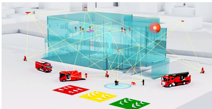
指揮支援システム イメージ図