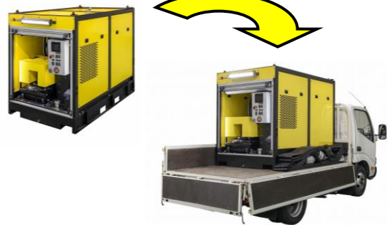
車両積載イメージ(2tトラック)

「排水ポンプユニット」:エンジンや水中ポンプなどの必要な装置は、ユニット内に収納されるためコンパクトで、平時は車載せずに防災倉庫などでの保管が可能です。