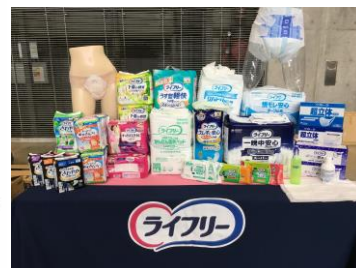
もしもの備えに 衛生用品