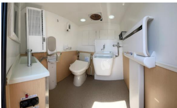
ユニバーサル仕様 (オプション)

トイレカーは、オプションとしてオストメイト対応トイレやベビーベッド、ベビーキープを取り付けたユニバーサル仕様や、車椅子リフターを装備した仕様にも対応が可能で、どなたでも安心してトイレを利用することができます。