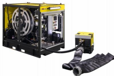
浸水・冠水現場での排水時に活躍する 油圧式排水ポンプユニット