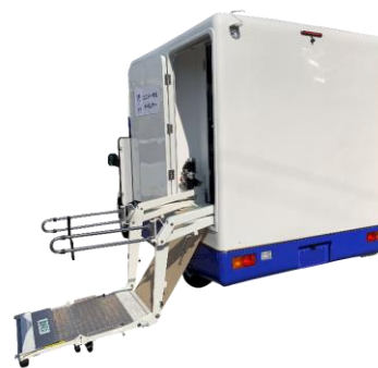
車椅子リフター仕様 (オプション)