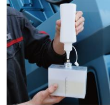
【香料タンク】 容量 200ml で 簡単操作で詰替え