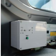
【制御BOX】 運転席後部に取付