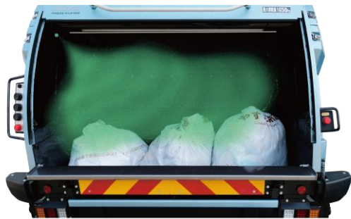
※画像は噴霧イメージです。