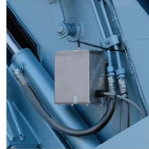
【噴霧装置】 テールゲート 側部に取付