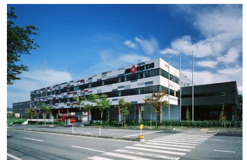
モリタ三田工場(兵庫県三田市)

最優秀賞に選ばれたお子様はモリタオリジナルグッズプレゼントのほか、株式会社モリタ さんだ 三田工場(兵庫県三田市 さんだ )へご招待いたします。このモリタ さんだ 三田工場は日本最大の消防車製造工場で、国内の消防車の過半数がこの工場で誕生しています。