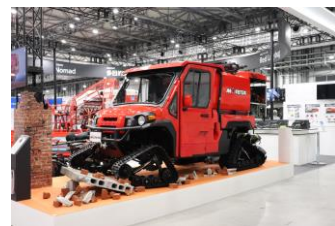
小型オフロード車 Red Ladybug

当コンテストもこれらの活動の一環として、お子様の豊かな想像力を育むことを目的にスタートしました。ぜひ夢いっぱいの「未来の消防車」を描いてみませんか。アイデア豊富で夢のある作品のご応募をお待ちしております。