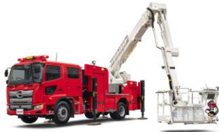
21m ブーム付多目的車 MVF21

モリタグループは1907年の創業から「人と地球のいのちを守る」をスローガンに、安全で住みよい豊かな社会づくりに取り組んでまいりました。近年では、多様化する火災現場で対応可能な「21mブーム付多目的消防ポンプ自動車 MVF21」に加え、増加する大規模水災害で安全に救助活動を行える「救助用エアボート FAN-BEE(ファンビー)」や、高い走破性を備えた「小型オフロード車 Red Ladybug(レッドレディバグ)」などの開発を通じて私たちの思いをお伝えしてまいりました。