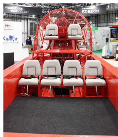
救護スペースを確保

「救助用エアボート FAN-BEE」は、推進器が船体上にあるため水中にスクリーなどの突起物がなく、その上、船底にはナイロンプレートを採用し、フラットな構造となっているため、浮遊物の多い河川や浅瀬、中洲(陸地)も移動することができます。高い安全性と抜群の走破性により、人命救助から物資運搬まで、あらゆる水害現場での活動をサポートします。また、水上での最高速度は約 70km/h(37kt)を誇ります。船体はアルミプレート 2 重構造で、その間にウレタンフォームを注入しているため、障害物等との衝突により船体が損傷した場合も、浮力を保ったまま運行できます。定員は最大 8 名ですが、要救助者の救護をするスペースも確保しています。