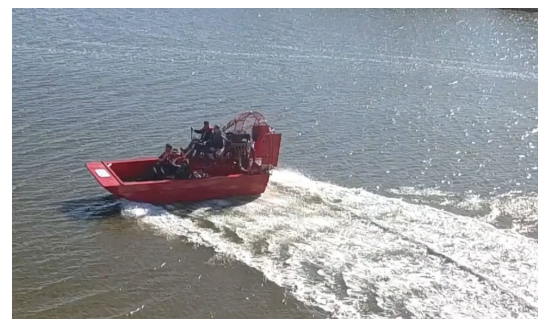
「救助用エアボート FAN-BEE」