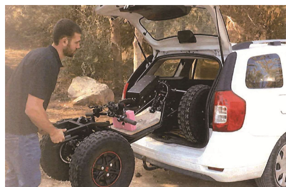
「折り畳み式電動資機材搬送車 EZ-Raider」