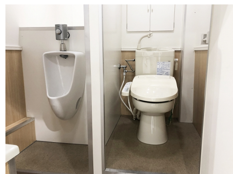
移動式トイレ「トイレカー」