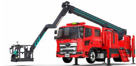
多目的消防ポンプ自動車 MVF21