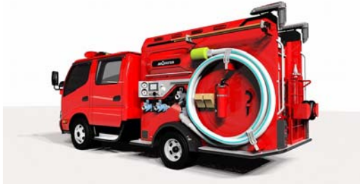
普通免許対応 車両重量 3.5t 未満 CD-I 型消防ポンプ自動車 ミラクル Light

当社の連結子会社である株式会社モリタ(本社:兵庫、代表取締役社長:尾形和美)は、「普通免許対応 車両重量 3.5t 未満 CD-I 型消防ポンプ自動車 ミラクル Light」と「多目的消防ポンプ自動車 MVF21 (MORITA VARIOUS FIGHTER 21)」を開発しました。本製品は、5月31日(木)～6月3日(日)に東京ビッグサイト(東京都江東区)にて開催の「東京国際消防防災展 2018」に出展いたします。