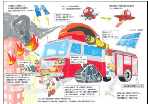
最優秀賞 中条 匠晴さんの作品

最優秀賞に選ばれた小学 6 年生(応募当時)の中条 匠晴さんには、モリタオリジナルグッズプレゼントのほか、モリタ三田工場(兵庫県三田市)へご招待いたします。このモリタ三田工場は日本最大級の消防車製造・メンテナンス工場で、国内の消防車の過半数がここで誕生しています。中条 匠晴さんには、モリタ三田工場で様々な車種の消防車をご覧ください。なお、工場見学の日程はご相談の上、決定いたします。