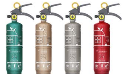
住宅用強化液(中性)消火器「キッチンアイ」

・酢ツキリと キッチンアイで エコ消火 (宮城県・女性) ・目・耳・鼻 トリプルスリーで 火の確認 (三重県・男性) ・不注意で ネットも火事も 大炎上 (岩手県・男性) ・悔やんでも 白紙撤回 できぬ火事 (東京都・女性) ・消し忘れ 心の油断に 猛タックル (埼玉県・男性)