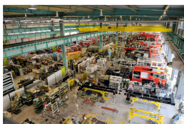
モリタ三田工場見学