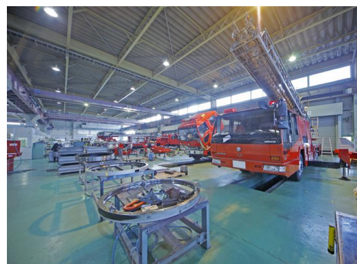
はしご車のオーバーホール風景