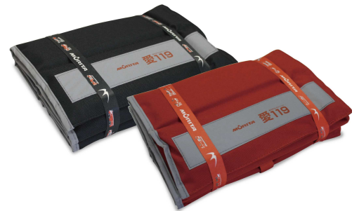
防災ずきん&クッション「愛119」

通常はクッション、イザという時には防災ずきんに変身する商品です。災害時だけ使用するのではなく、日ごろ、身近な場所でクッションとして使用することでお役に立ちます。