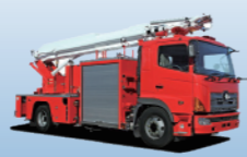
大型化学高所放水車