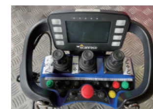
<遠隔操作用コントローラ>