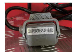
<原液搬送車接続コネクタ>