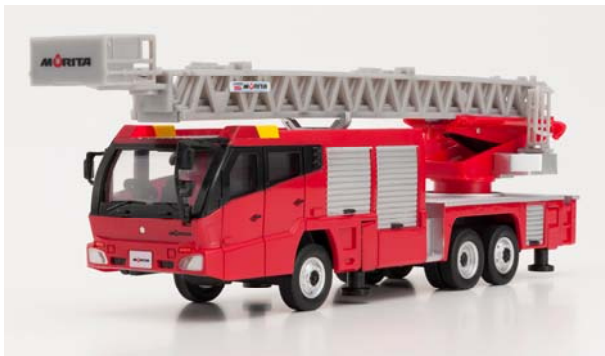
モリタはしご消防車 スーパージャイロラダーミニカー

私たちモリタグループは、「人と地球のいのちを守る」というスローガンのもと、防災に携わるメーカーとして絶えず技術革新に挑み、真摯な企業活動を通じて、人と人の絆、人と地球との絆、地球といのちとの絆を今まで以上により一層深めてまいります。