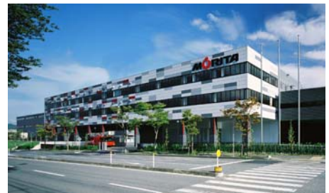
三田工場(兵庫県三田市)

入賞者の発表は、例年当社の創業記念日である4月23日(消防車の日)に株式会社モリタホールディングスのWebサイト上で行っておりますが、2017年4月23日は日曜日のため、翌日の4月24日(月)に行う予定です。