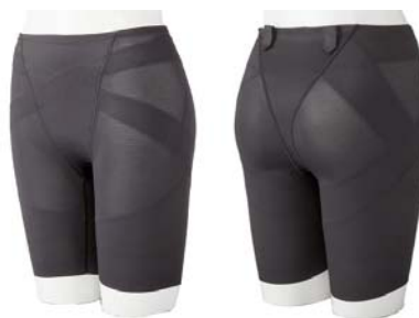
ショーツレギンス