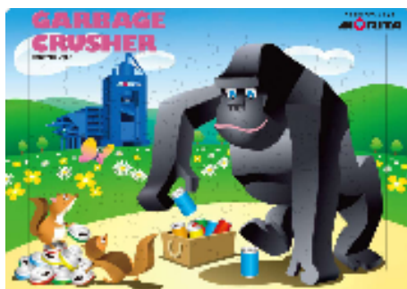
ジグソーパズル(ギロチンプレス)

【クイズ】モリタ環境テックが開発・製造・販売をしているスクラップ処理機器「高機能ギロチンプレス」。その切断スピードは 1 分間に何回でしょう？答えは、モリタ環境テックホームページにあります。 http://www.morita119-kt.com/