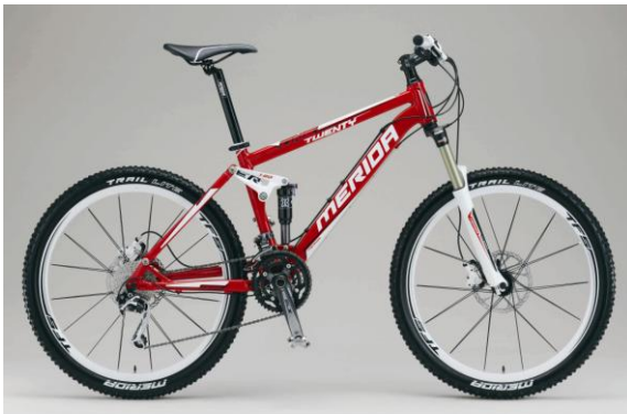
ONE TWENTY TFS 800-D