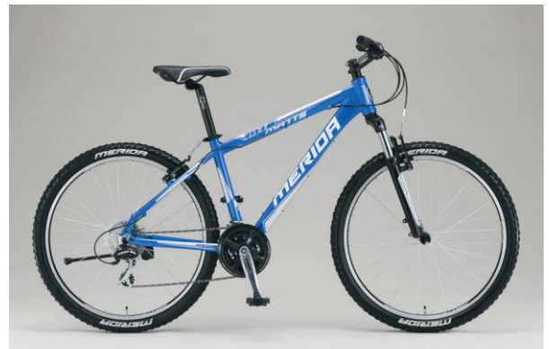
MATTS TFS 20-V