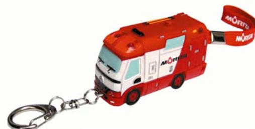
防犯ブザー・消防車 FFA

モリタ「防犯ブザー・消防車 FFA」に関する商品概要及び特徴は次頁のとおりです。